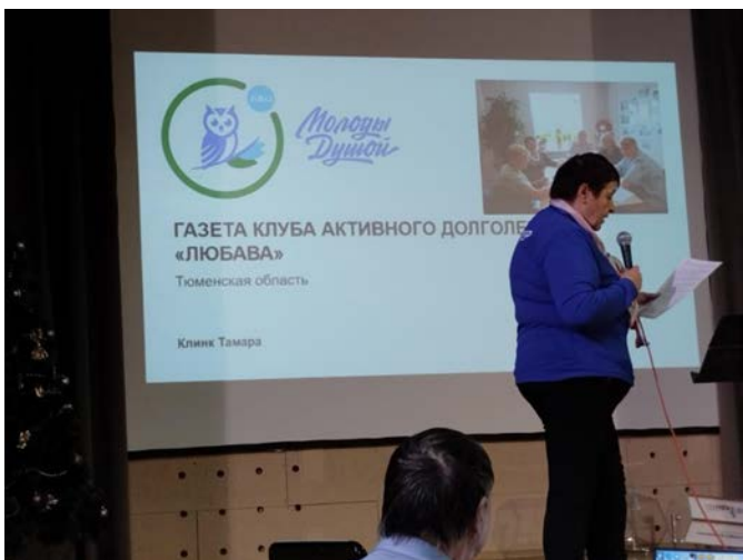
Презентация газеты «Любава»

Специальный волонтерский заезд стартовал в декабре. В течении двух недель «серебряные» волонтеры будут отдыхать, укреплять здоровье и готовиться к дальнейшей добровольческой деятельности. Отдых волонтеров проходит с пользой. Они проводят мастер классы, делятся опытом, рассказывают о реализации своих проектов. Творим добро, живем активно со смыслом!